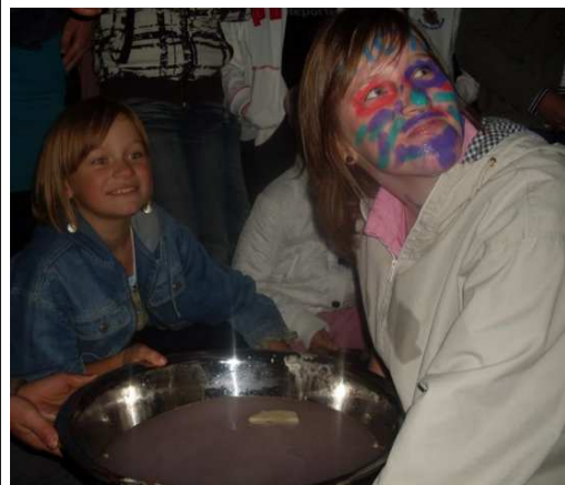
Miau...Ta zupa wygląda apetycznie

30.09.2010r. odbyła się dyskoteka szkolna, na której nasze „Kociaki” zostały wprowadzone w grono Gimnazjalistów poprzez złożenie uroczystej przysięgi "Ja .... biorę Ciebie ta o to Szkoło za męża/zonę i ślubuję Ci, że będę nauczycieli się słuchał/a lekcje czasem odrabiał/a oraz często się śmiał/a oraz przyrzekam Ci miłość, wierność i uczciwość małżeńską, oraz że nie opuszczę Cię do końca klasy III".