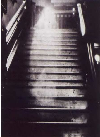
Duch czy złudzenie?

Wiara w duchy jest bardzo starym i powszechnym zjawiskiem. Już rzymski pisarz i polityk Pliniusz Młodszy, zmarły około 113 roku n.e., donosi o upiornej postaci, która zakuta w łańcuchy wędrowała po domu, a następnie znikła w podłozie. Kiedy później rozkopano to miejsce, znaleziono zakuty w łańcuchy szkielet.