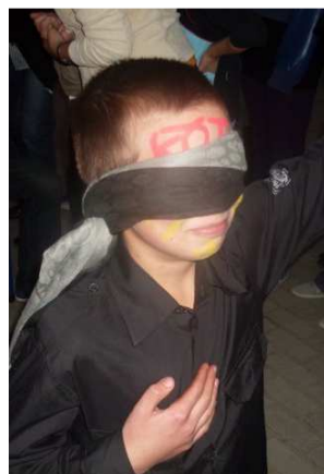
Jak mamę kocham, że będę się uczył...