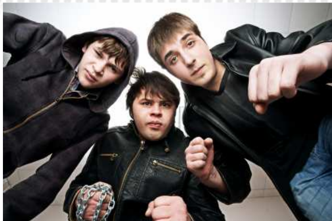
Wyobraź sobie, że patrzą na ciebie...