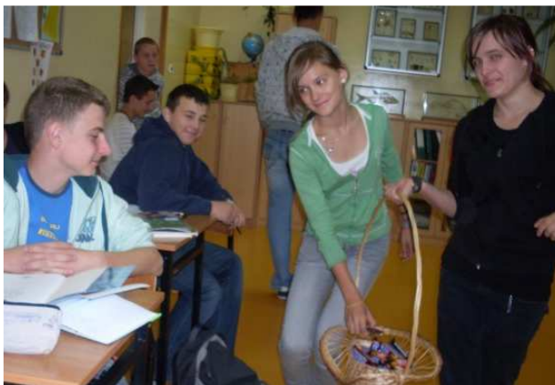
Sto lat Chłopaki!