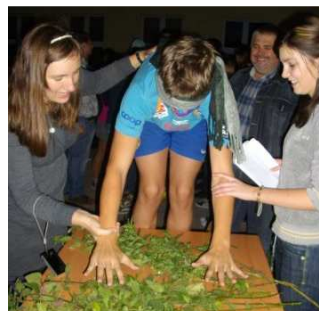
A pan Stasiu patrzy i pozwala na moje męki