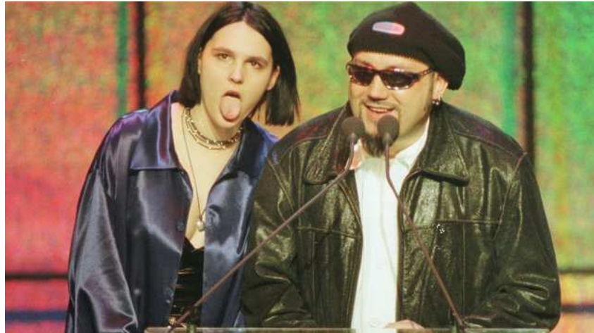
1997 r. Chylińska odbiera Fryderyka i wygłasza swoją słynną opinię o nauczycielach