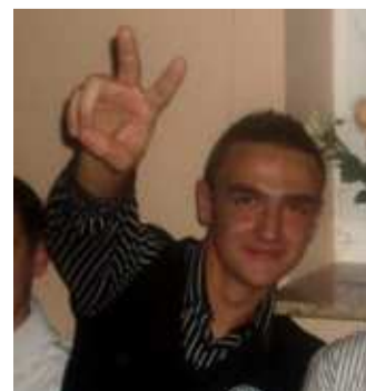
Pozdro dla moich ziomków