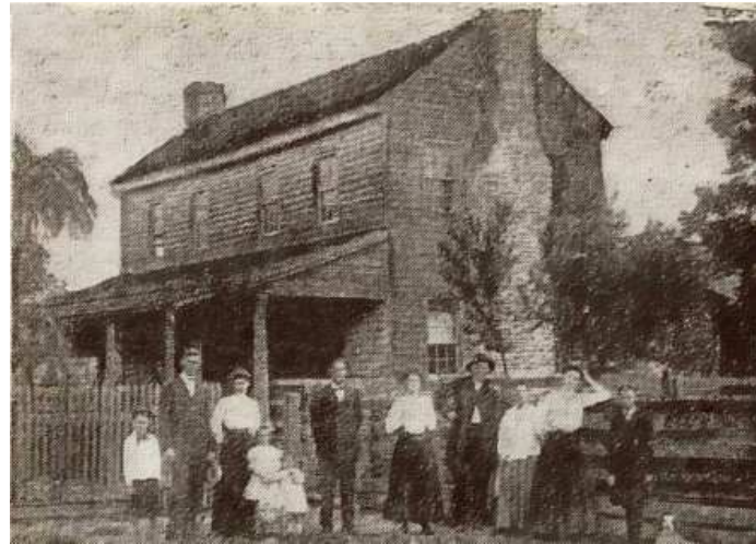
To jedno z tych nawiedzonych angielskich miejsc

Jednym z najstraszniejszych "strasznych domów" była plebania w Boreley w prowincji Essex – uchodziła ona za najbardziej upiorny dom w całej Anglii. Rzekomo przez całe dziesięciolecie jako duch pojawiała się tu zakonnica: pozostawała niewidzialna, lecz ciskała miskami, kamieniami albo monetami przez pokój, ciecze przemieniała w atrament, zwracała na siebie uwagę pukaniem i sprawiała, że znikwały niektóre przedmioty. Później wybuchł pożar i dom spłonął.