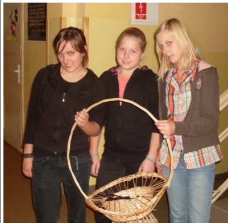
Nasze Atomówki w akcji

30 września świętowaliśmy Dzień Chłopaka. W niektórych rejonach Polski święto to obchodzi się 10 marca.